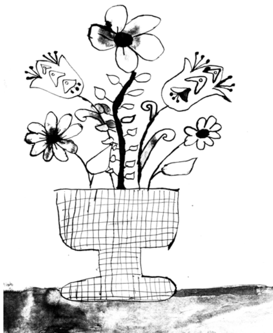
Goór Krisztián munkája, 8.6