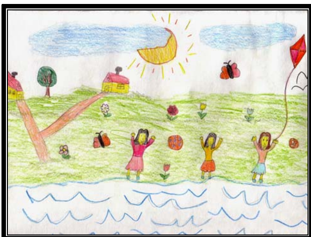
Попов Наташа, 2.а