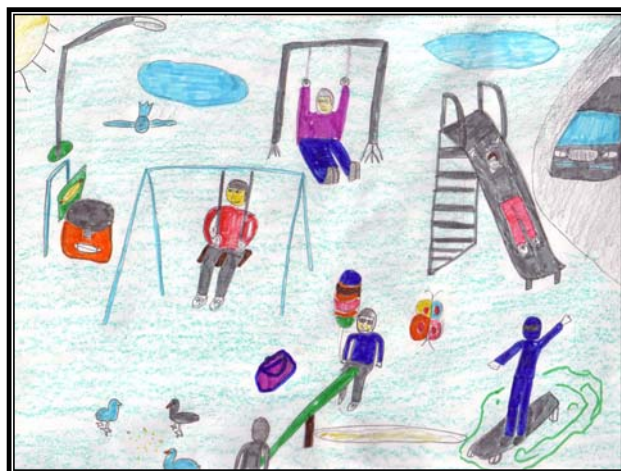
Ђурџић Саша, 2.а