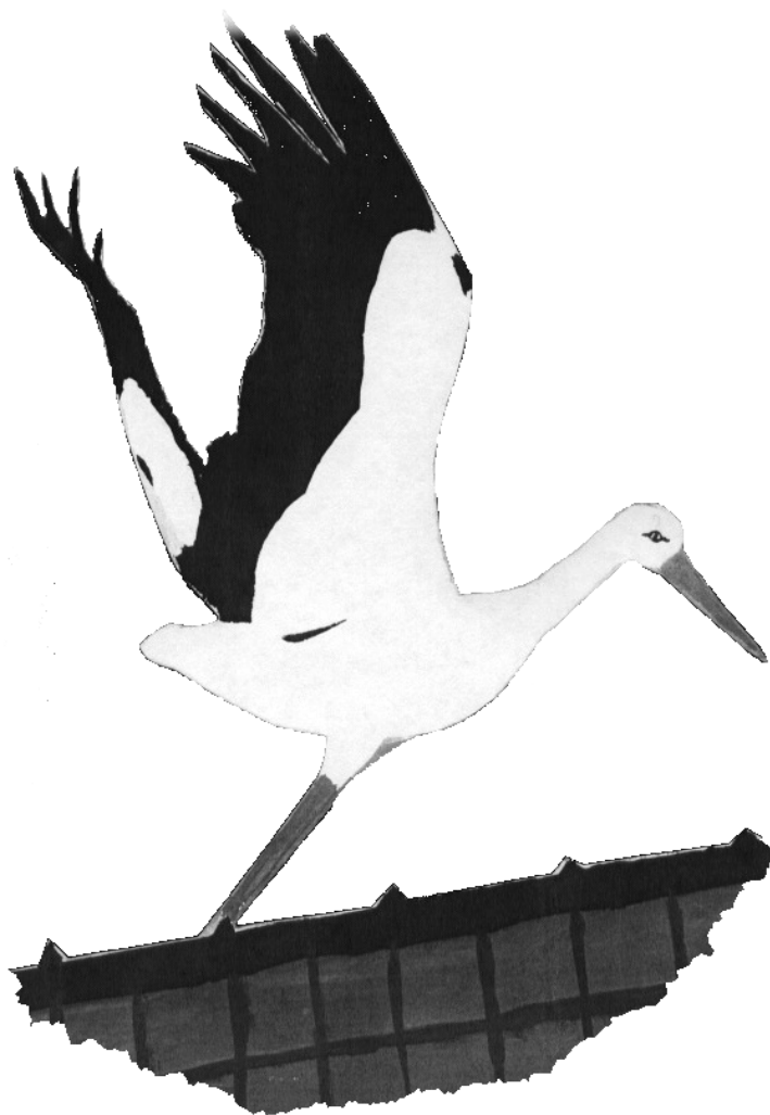
Bakos Géza (7.6): Gólya című munkája